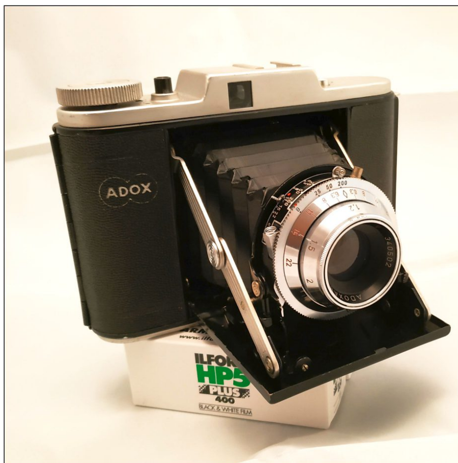
Die ADOX Golf 63 ausgeklappt.

Zunächst noch etwas zu der Kamera selbst. Es war in den 50er Jahren der Volkswagen unter den Kameras und wurde ab 1954 und bis 1958 produziert. Ich selbst habe wohl das letzte Modell, also eins, was vermutlich 1958 produziert wurde. 100% genau weiß ich letztlich nicht, ob sie nicht vielleicht doch von 1957 ist. Aber - und das weiß ich ganz sicher - sie ist älter als ich und funktioniert (so wie ich auch) noch.